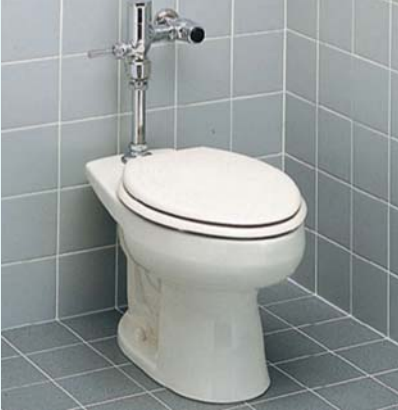
■改修前（手動式フラッシュバルブ水栓）