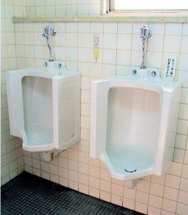
■改修前（手動式フラッシュバルブ水栓）